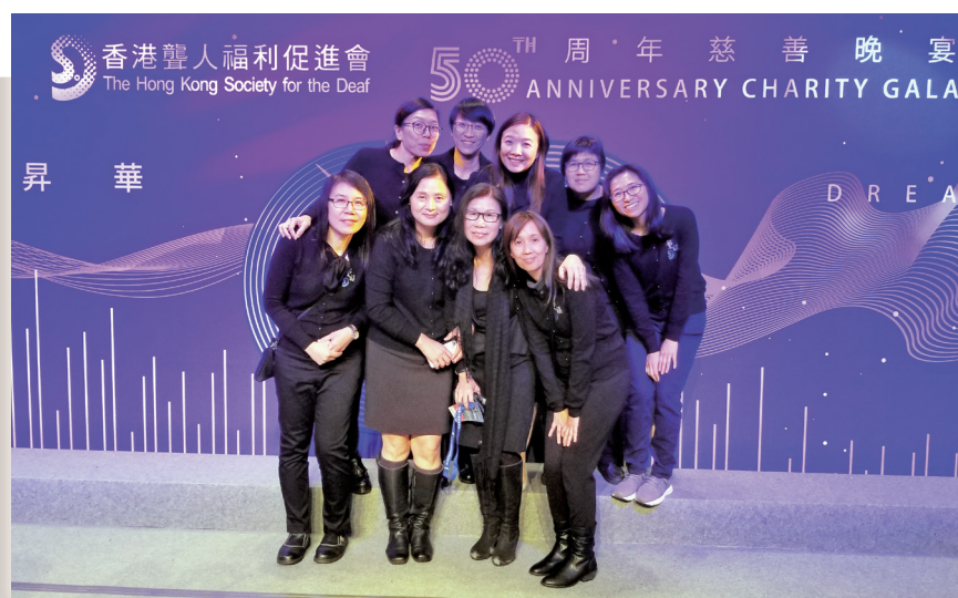
聾福會一眾手語傳譯員。

手語傳譯員與兩位聽障手語主持都擔當著非常重要的崗位，經過近半年的拍攝，主持們指在拍攝過程中可以充分發揮自己的才能，找到了很大的滿足感，未來亦希望可以嘗試不同的角色，幫助聽障人士與社會接軌，以輕鬆有趣的手法為觀眾提供更多時事資訊，將歡樂繼續帶給大家！