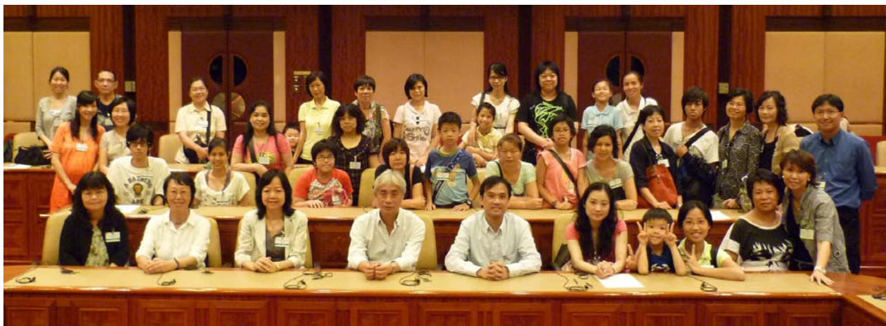
◆會方代表曹莉莉校長(前排左二)、黃何潔玉女士(前排左三)、家長及聽障學生與立法會梁耀忠議員(前排左四)在會議廳合照。

本會將繼續跟進事項，亦十分感謝梁耀忠議員的協助，以及當日冒著黑色暴雨警告出席參與的家長和學生們。